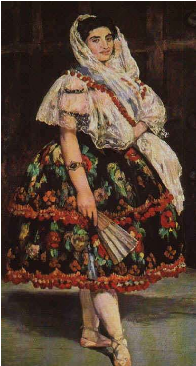
UNA SONRISA CÓMPLICE