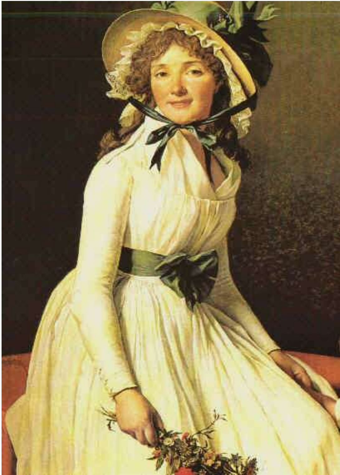
UNA SONRISA DULCE