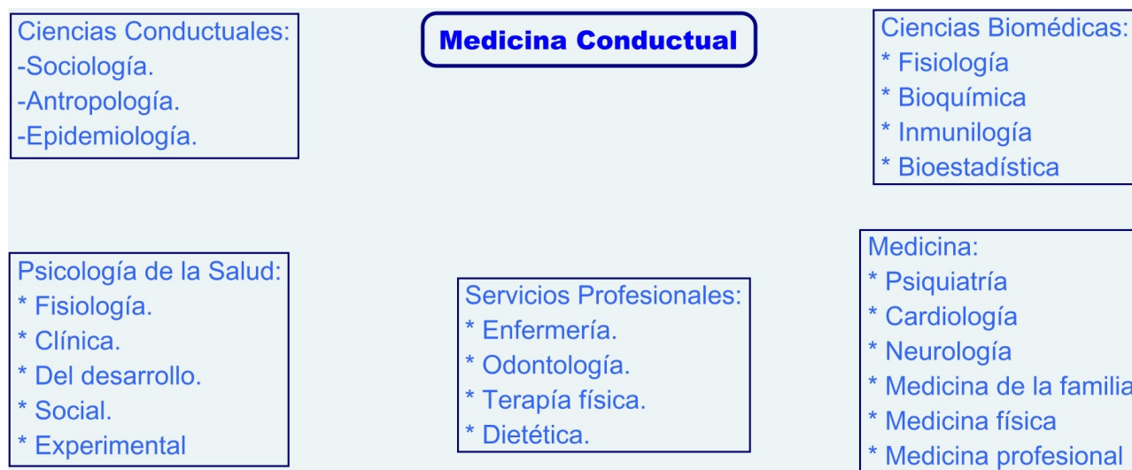
Ilustración 1: Medicina de la conducta.