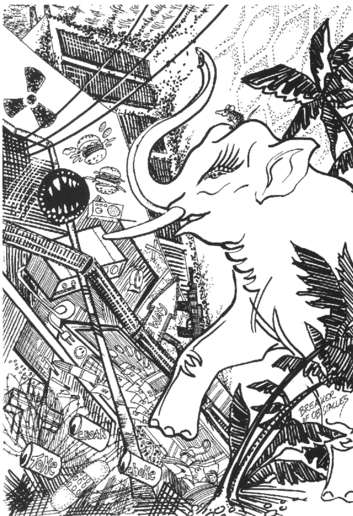
Ganesha, el destructor de obstáculos