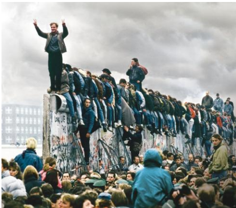
Caída del Muro de Berlín