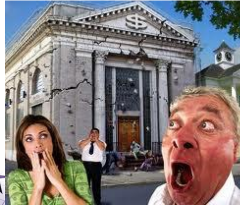
Quiebra de Lehman Brothers

En el mes de marzo de 1993 escribí un mini ensayo sobre la situación económica de la España de la época, el cual no fue publicado. Las editoriales a las que lo remití no le encontraron suficiente interés para su publicación; tal vez su contenido liberal no casaba con el ambiente político-económico del momento.