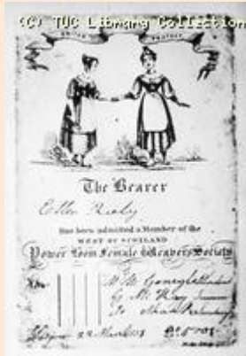
Tarjeta de los miembros la Sociedad de Mujeres Tejedoras del Oeste de Escocia de 1833.

1836. La Liga de los Conscriptos se transformó en la Liga de los Justicieros. Sus integrantes fueron sastres, como Guillermo Weitling, zapateros, sombrereros, etc.