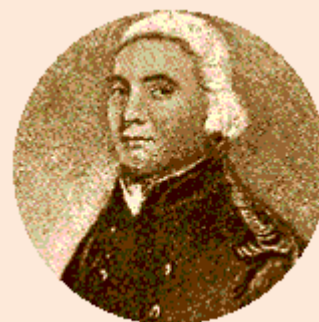
The Man Who Framed the Martyrs