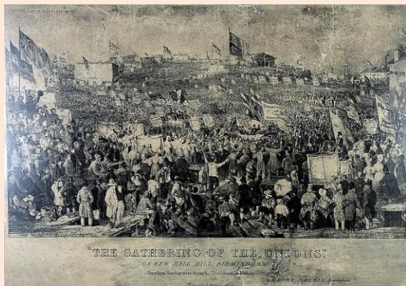
"The Gathering of the Unions" on New Hall Hill, Birmingham, meetings in May 1832 ("El Encuentro de las Uniones" en la New Hall Hill, Birmingham; bocetos tomados durante los tres mitines sucesivos, de mayo de 1832, por Henry Harris; G. Hullmandel

Mientras tanto, un capitalista, Fairbairn, ante la parálisis de su factoría por una huelga obrera, inventa el sistema Self-acting mule , para fabricar maquinarias.