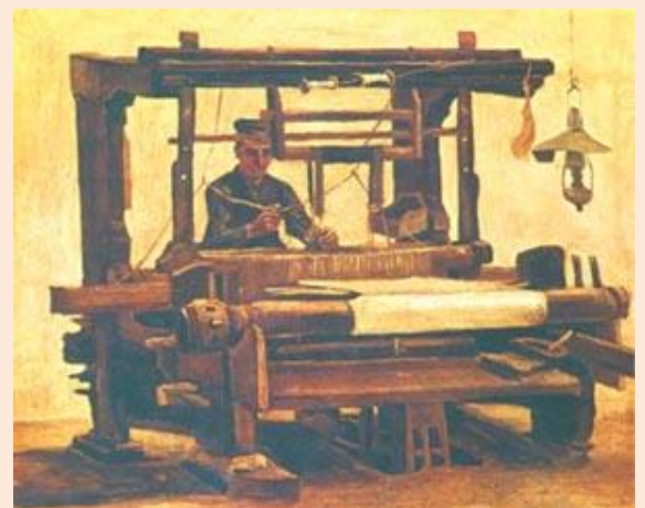
Tejedores de Van Goh