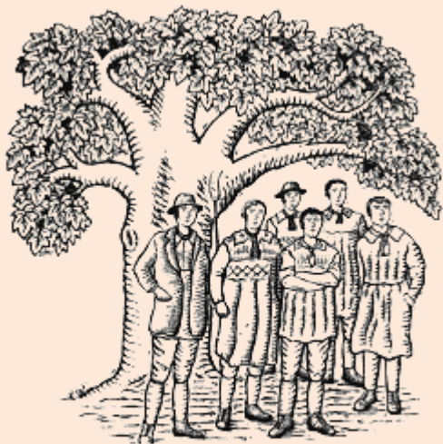
James Loveless John Standfield James Brine James Hammett George Loveless Thomas Standfield

En Inglaterra se publica la llamada Ley de Pobres , que promueve un salario mínimo vital, que provoca el éxodo de campesinos a las ciudades.