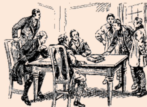
Sociedad Mutual de Obreros Agrícolas

El 21 de abril de 1834, se manifestaron miles de trabajadores y sus familias contra las sanciones a los Mártires de Tolpuddle. La manifestación fue organizada por el Comité Central Metropolitano de los Sindicatos. Marcharon de Londres a Kennington. Llevaron un vagón con una solicitud con 200,000 firmas para la remisión de los Mártires sentencias. Mister Melbourne, Ministro, se negó a aceptar la petición.