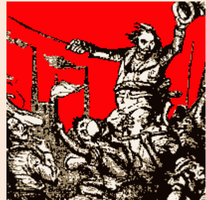
Levantamiento Luddita (Grabado)

ejercían violencia alguna contra las personas por lo que recibieron un fuerte apoyo de la población de las comarcas inglesas.